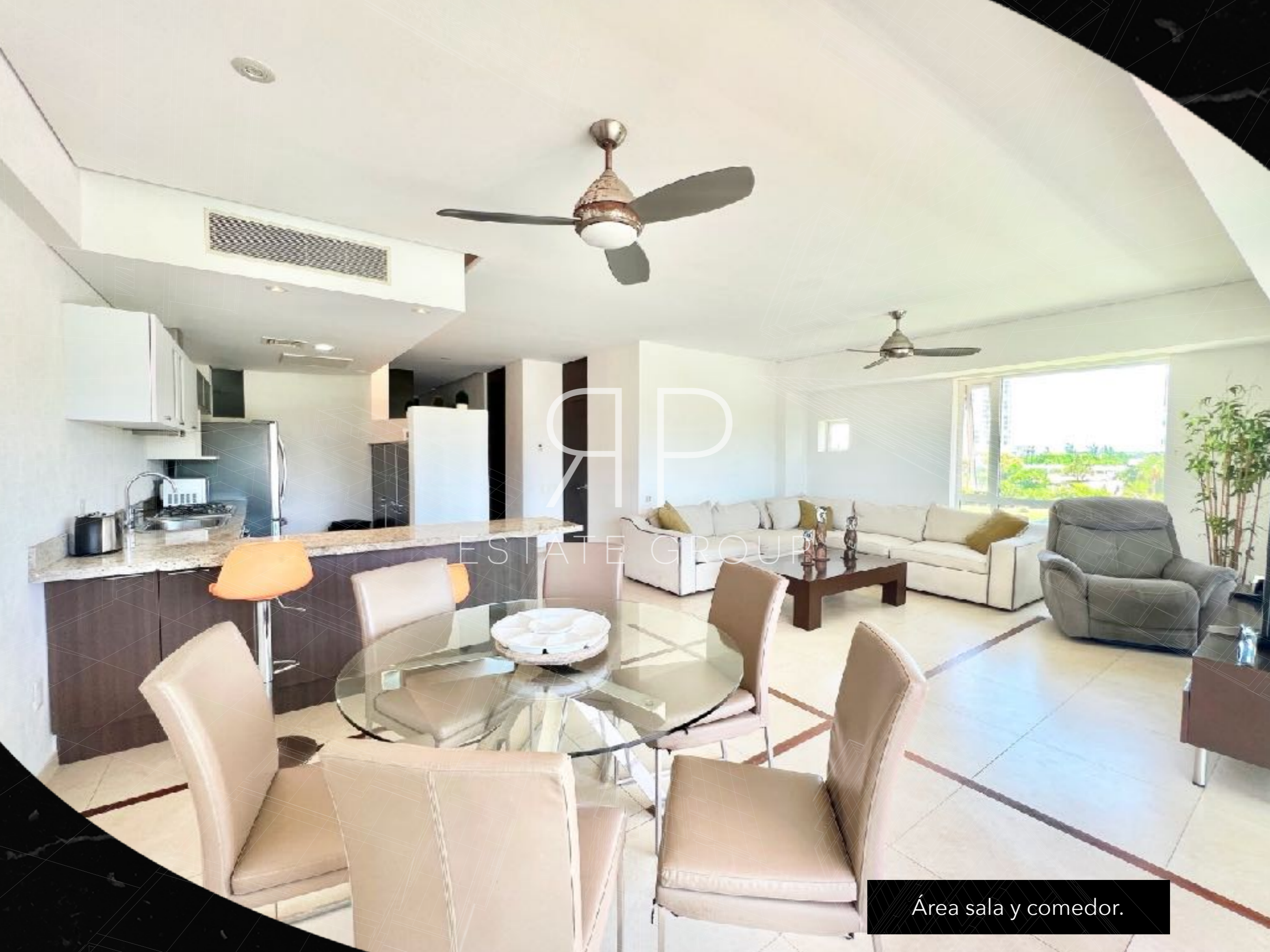
Área sala y comedor.