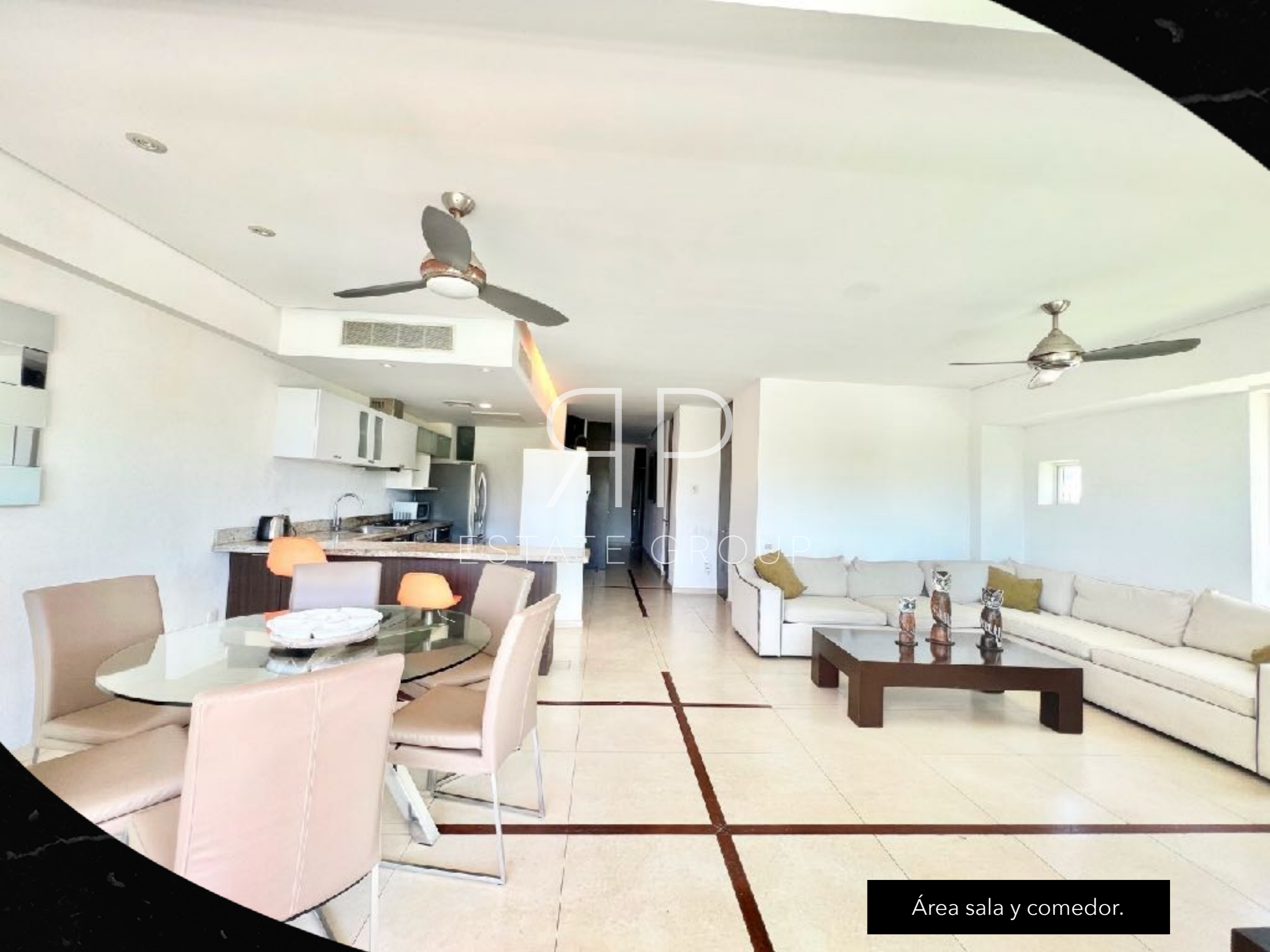
Área sala y comedor.