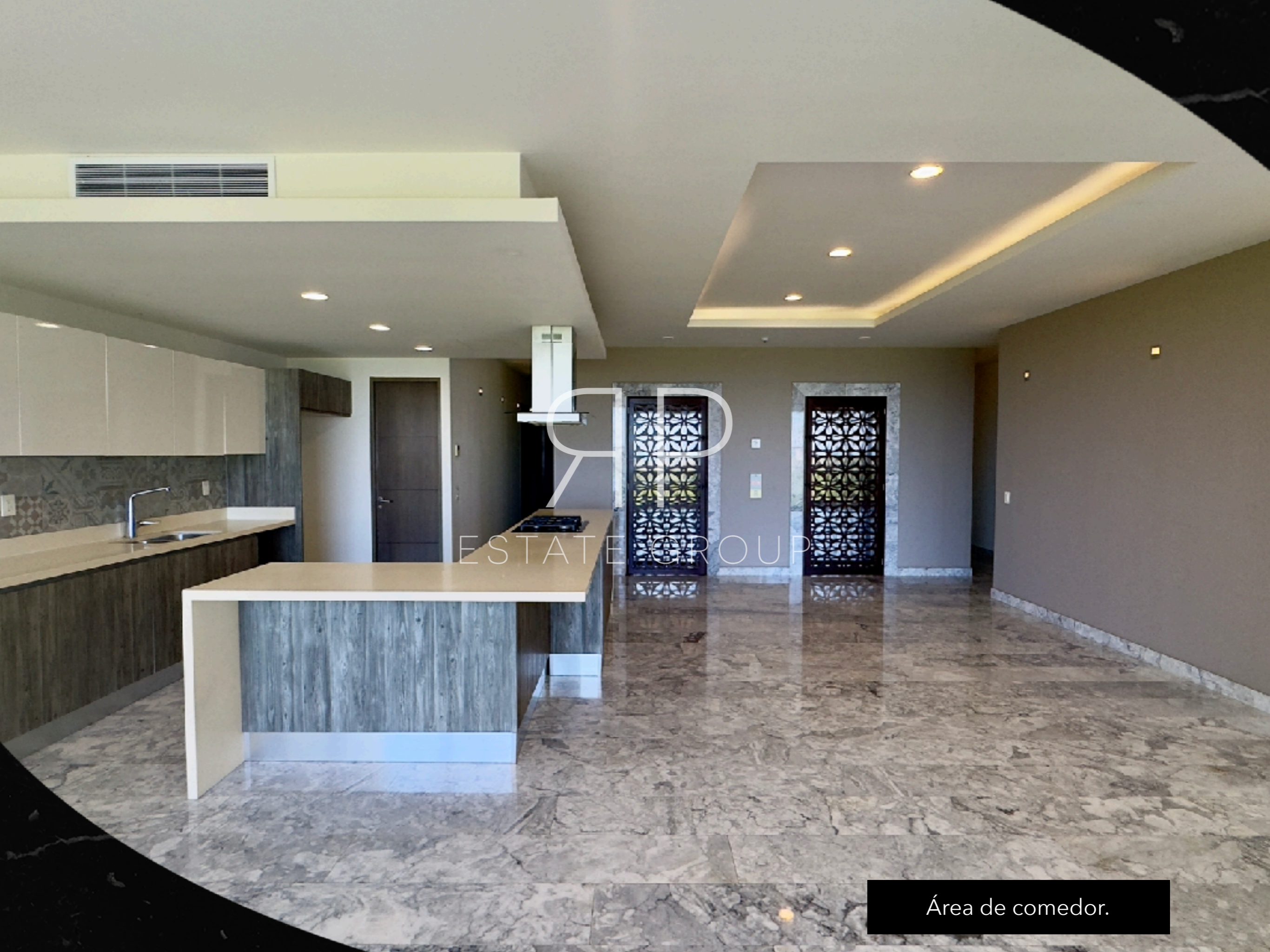
Área de comedor.